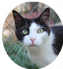
« TINY »