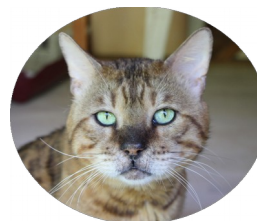
« GOFFY »

Goffy , bengale mâle âgé de 10 ans, a été recueilli au refuge suite au décès de son propriétaire. Très sympa, indépendant, son regard émeraude va vous faire fondre ! Aspire à une retraite tranquille dans une maison avec jardin, sans autre partenaire.