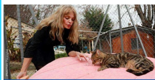
Arielle Dombasle reine des chats

Marraine de l'association de Vence depuis deux décennies, la star lui a attribué la somme couronnant sa victoire à l'émission les Reines du Shopping, avec Cristina Cordula (M6).