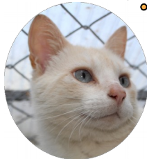
et « GANDY »

Tiny , mâle âgé de 10 ans, est un gentil chat timide aimant les caresses. Après le décès de sa propriétaire, il attend son nouveau foyer au sein d'une maison avec jardin sans la possibilité d'autres partenaires.