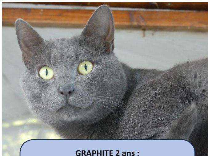
GRAPHITE 2 ans :

Les années passent, mais nous ne pouvons que constater et heureusement que les rapports avec les élus qui aident le refuge sont toujours de bonne qualité. Leur aide nous est toujours indispensable, nous en sommes conscients et nous les remercions vivement et sincèrement.